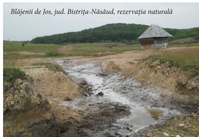
Blăjenii de Jos, jud. Bistrița-Năsăud, rezervația naturală

fi puse la dispoziția unei largi audiențe în cadrul unui tur virtual al peisajelor culturale salifere. Astfel, publicul va putea admira peisajele salifere ale Transilvaniei în fața calculatoarelor, prin vizionarea unor prezentări virtuale