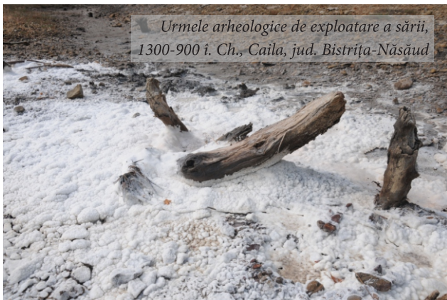
Urmele arheologice de exploatare a sării, 1300-900 î. Ch., Caila, jud. Bistrița-Năsăud

Harghita), zona Corund – Praid – Sovata (județele Harghita și Mureș), Valea Gurghiului (județul Mureș), Bazinul Someșului Mare (județele Bistrița-Năsăud și Cluj), văile Arieșului și Someșului Mic (județul Cluj), Valea Mureșului Mijlociu (județul Alba), Depresiunea Sibiului (județul Sibiu). Totodată, în aceste prezentări se vor regăsi și referiri la zonele sărace în manifestări saline, printre care cele aflate în depresiunile intramontane Brașov, Baraolt, Ciuc și Giurgeu din sud-estul și estul Transilvaniei.