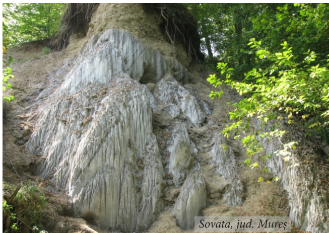
Sovata, jud. Mureș

Transilvania este deosebit de bogată în peisaje salifere care îmbină manifestări saline naturale și cele datorate activității umane de exploatare a sării – vestigii arheologice, istorice și etnografice. Multe dintre aceste peisaje au fost cercetate de geologi, biologi, arheologi, etnografi și istorici, rezultatele cercetărilor fiind publicate în principal în lucrări științifice adresate preponderent mediului academic. Publicul larg însă nu este familiarizat cu acest patrimoniu prețios.