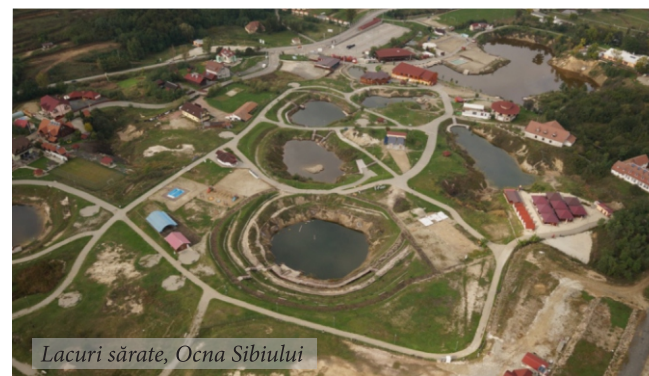
Lacuri sărate, Ocna Sibiului