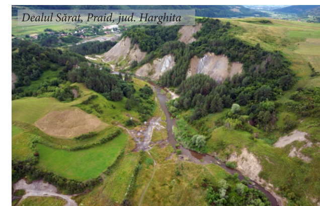
Dealul Sărat, Praid, jud. Harghita

alcătuite din numeroase fotografii și înregistrări video realizate de la sol și din aer, însoțite de comentarii și explicații simple, într-un limbaj ușor de înțeles.