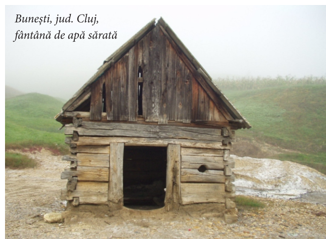
Bunești, jud. Cluj, fântână de apă sărată