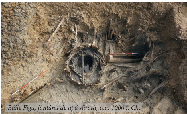
Băile Figa, fântână de apă sărată, cca. 1000 î. Ch.

Proiectul „Saltland. Călătorii virtuale prin peisajele culturale salifere ale Transilvaniei” și-a propus restituirea către societate a patrimoniului cercetat de specialiști, într-un format accesibil. Cele mai importante, relevante și spectaculoase manifestări saline – zăcăminte de sare gemă, izvoare, pâraie și lacuri sărate, sărături bogate în vegetație adaptată mediului salin – asociate cu vestigii arheologice, etnografice și istorice ce au compus, din preistorie până în prezent, o civilizație fascinantă a sării vor