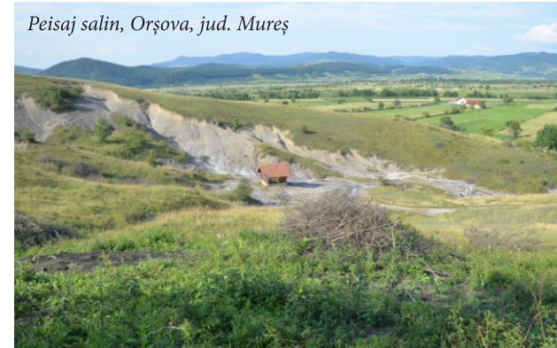
Peisaj salin, Orșova, jud. Mureș

alcătuite din numeroase fotografii și înregistrări video realizate de la sol și din aer, însoțite de comentarii și explicații simple, într-un limbaj ușor de înțeles.